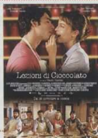
Lezioni di cioccolato (2007)