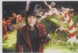
La fabbrica di cioccolato (2005)

Questi sono soltanto tre dei tanti film che hanno tra i loro interpreti principali proprio il cioccolato... Ne ricordi altri?